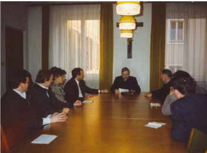
Begegnung des Zentralvorstandes des Kolpingwerkes Südtirol mit Bischof Wilhelm Egger am 15. März 1990.