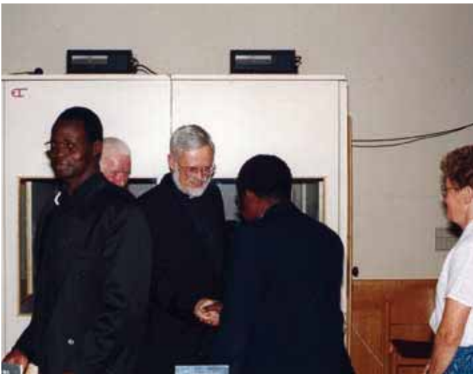
Bischof Wilhelm Egger begrüßt Kolpingvertreter aus verschiedenen Ländern.