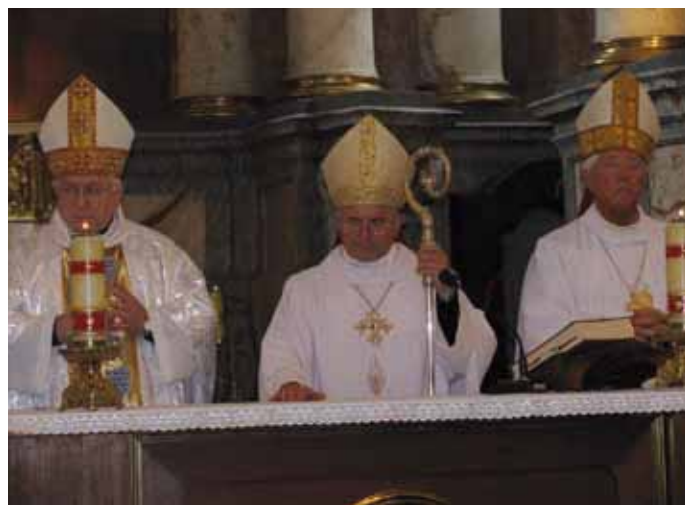
Gottesdienst mit dem Nuntius Erzbischof Peter Stephan Zurbriggen und Erzbischof Sigitas Tamkevicius und dem Altbischof