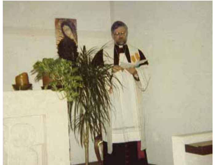
Wortgottesdienst mit Bischof Wilhelm Egger in der Kapelle des Kolpinghauses Bozen anlässlich des Generalrates des Internationalen Kolpingwerkes im März 1989.