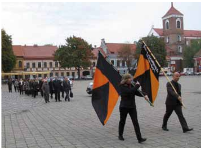
Festzug zur Jesuitenkirche in Kaunas

lich empfangen und mit einem Kleinbus gemeinsam mit den Gästen aus der Schweiz und Augsburg nach Kaunas gebracht. Am Samstag 4.10. ver-