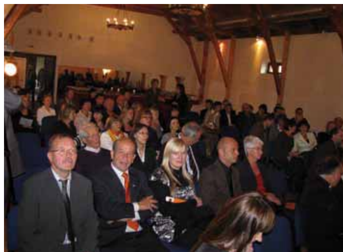
Die Südtiroler Delegation mit der scharmanten Übersetzerin und den vielen Festgästen