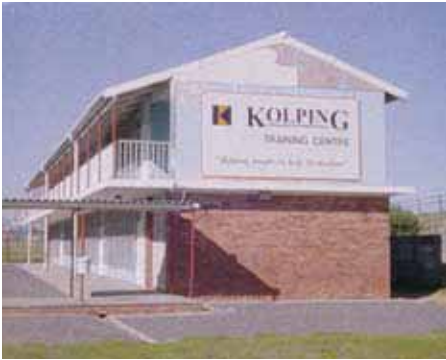
Kolping Training Center

wurde als eine Antwort entwickelt für die große Zahl der arbeitslosen Schulabsolventen, die an den Rand gedrängt wurden. Das Programm deckt den gesamten Prozess ab, den arbeitslose Personen benötigen, um sie wieder in einen Arbeitsplatz eingliedern zu können.